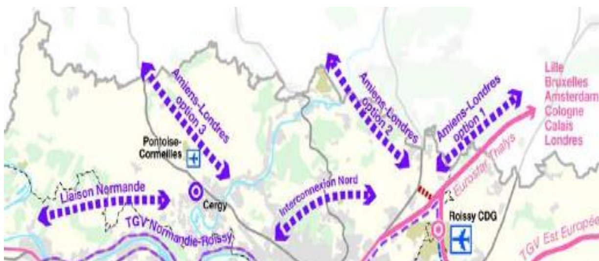
Extrait Rapport nouveau SDRIF page 74 adopté le 25 septembre 2008

En réalité, cette idée vient du maire d'Amiens, qui voulait son TGV perso et de notre député Paternotte pour son projet CAREX, un projet de fret ferroviaire, dont il est le président. Un old up sur la nature ! Il s'agit là d'une simple compensation politique imposé par un ancien ministre et un député de la même famille dont les intérêts sont personnels.